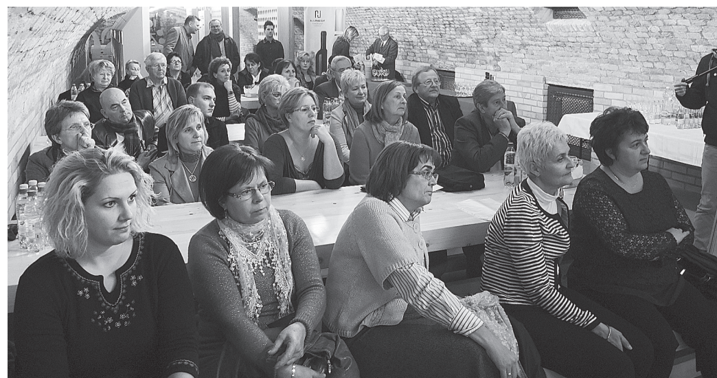
Negyven cég képviselője vett részt a Vendéglátók Napja rendezvényen

A grillázs formázható, ezért gyakran válik fénypontjává – az ebből készült torta által – a