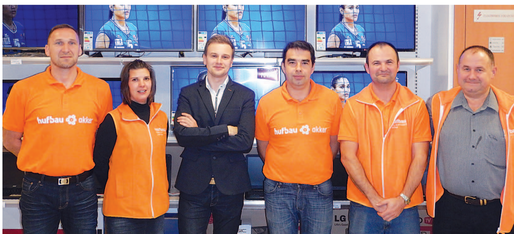
Az üzlet munkatársai – a forgalom jobb, mint amivel számoltak

lom jobb, mint amivel számoltunk a nyitás előtt. Persze, ebben benne van az újdonság és