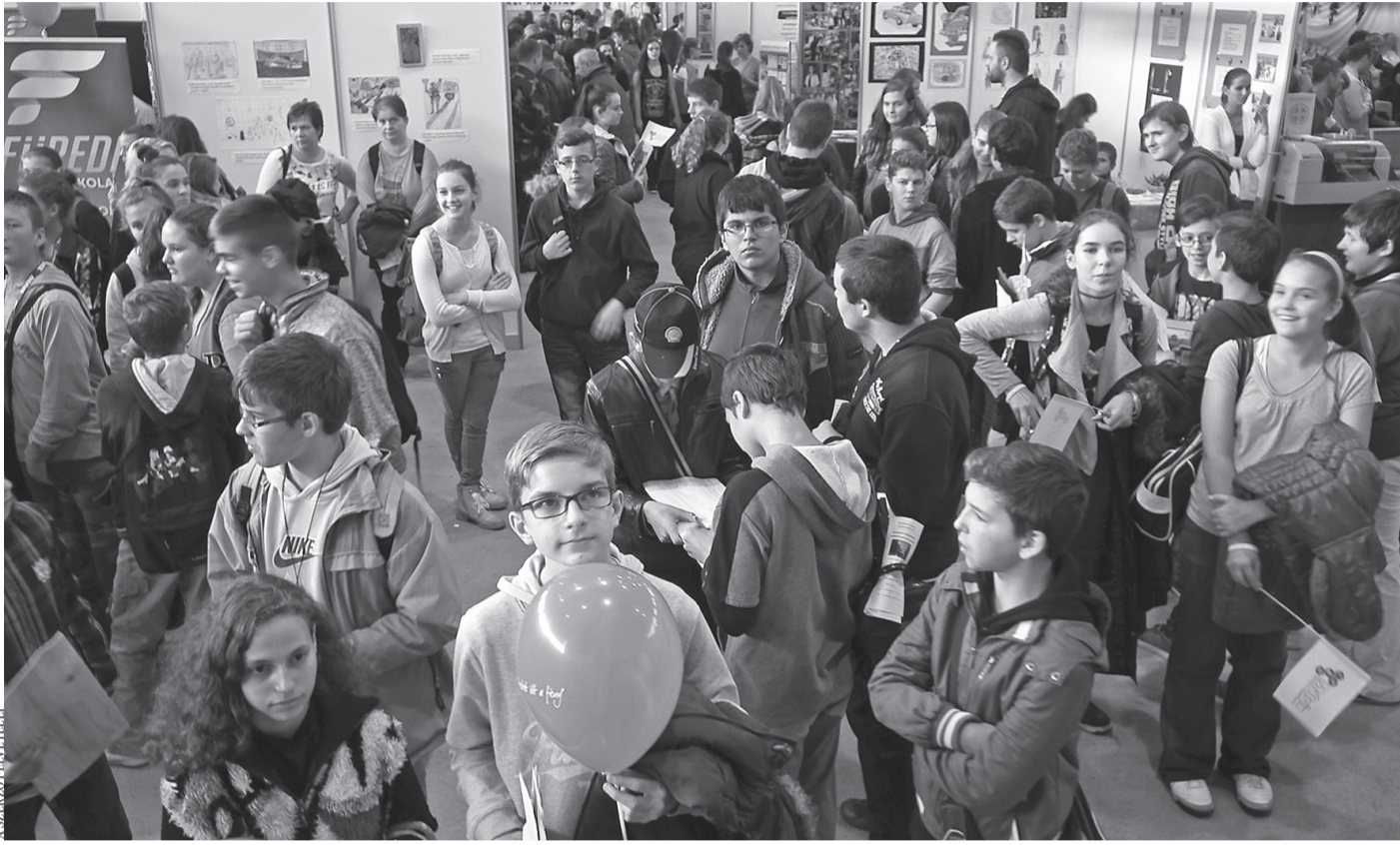
Pályaválasztási vásár a kecskeméti Lánchid utcai iskola csarnokában

TOVÁBBTANULÁS A hiányszakmát tanulók ösztöndíjat kapnak